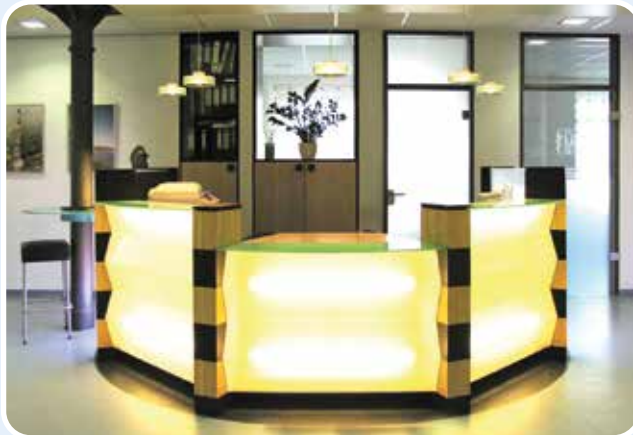
Praxis für Allgemeinmedizin M. Necke